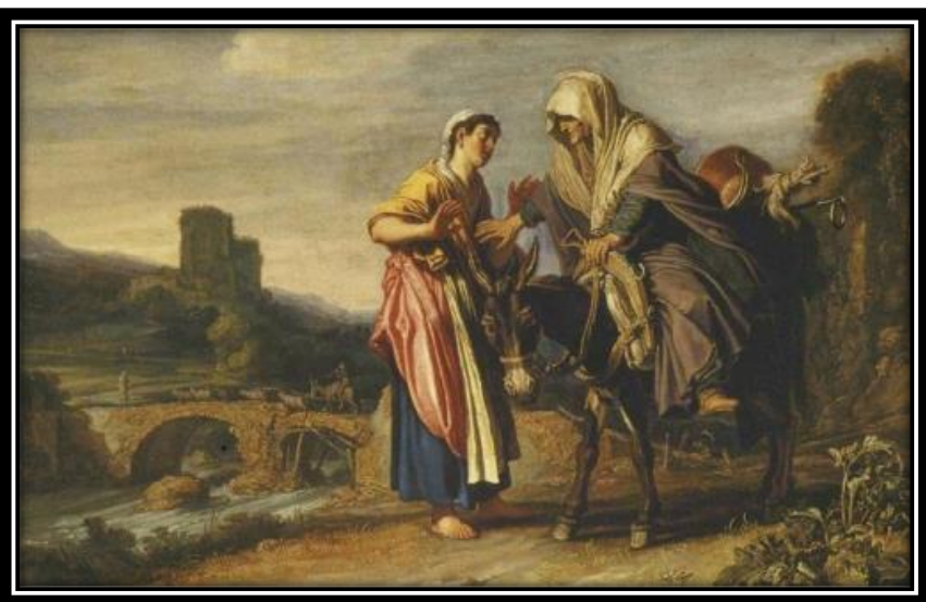
פיטר לסטמן, 1614

נסו לדמיין גם אתם כיצד נראה אותו הרגע, ובחרו בתמונה המשקפת זאת בצורה הטובה ביותר לדעתכם, או הוסיפו ציור נוסף: