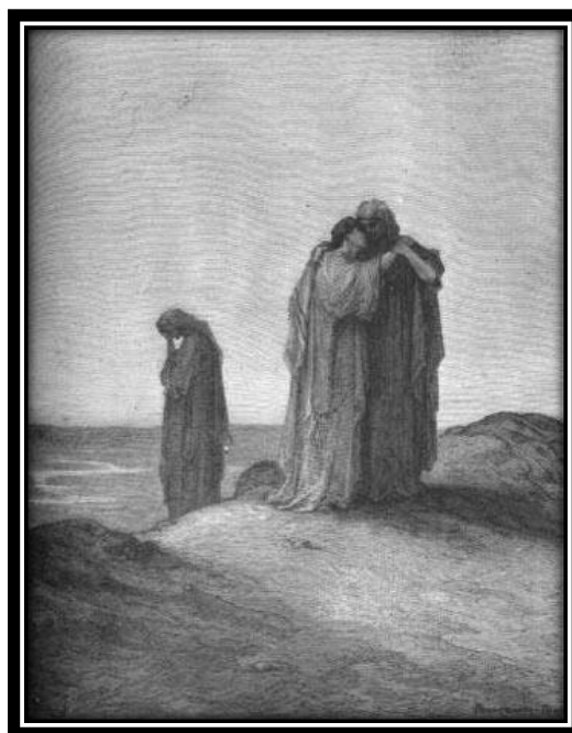
גוסטב דורה, 1880