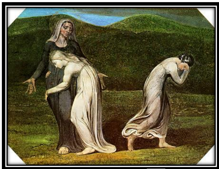
וויליאם בלייק, 1795