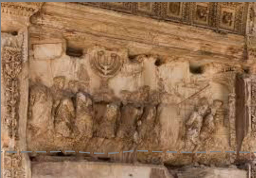
שער טיטוס ברומא