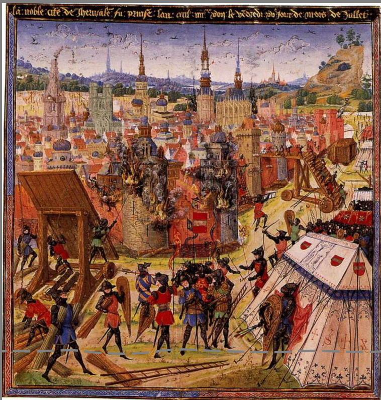
מסע הצלב הראשון מתוך ויקיפדיה

מסע הצלב הראשון בשנת 1096, שבמהלכו פגעו הנוצרים הצלבנים ביהודים והשמידו קהילות רבות בגרמניה ובצרפת. על-פי עדויות מן התקופה, הפרעות ביהודים היו בעיקר בחודש אייר ועד חג השבועות.