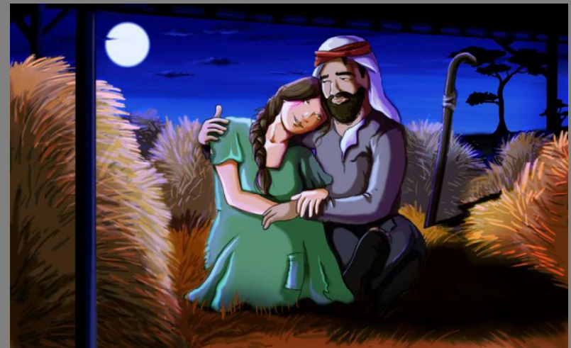
ר' עקיבא ורחל

לחצו על התמונה- וקראו את הסיפור מתוך ספר האגדה לילדים