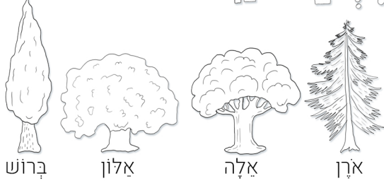
ברז אלון אלה ארן