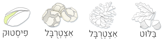
פיסטוק אצטרבל אצטרבל בלוט