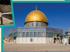
אנדרו שיבה, ויקיפדיה