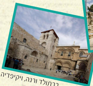
ברתולד רונה, ויקיפדיה