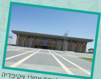
ג'יימס אמרי, ויקיפדיה