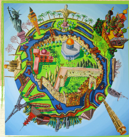
ירושלים מרכז העולם. ציר: רפי פרץ