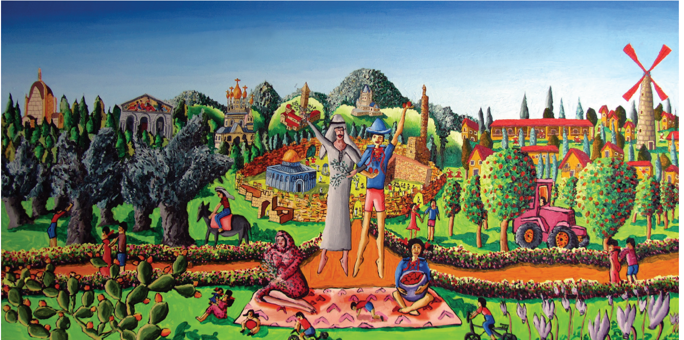
■ ציור נאיבי של העיר ירושלים | רפי פרץ

■ נצייר ציור שמסמל את השותפות בין אזרחי המדינה השונים.