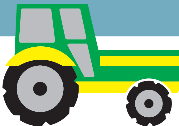
כלי התחבורה שמלווה את היחידה: טרקטור.

■ נזמין אדם מוותיקי היישוב שיספר לילדים על הקמת היישוב או על ההיסטוריה שלו.