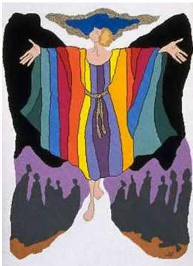
יוסף | פליפ רטנר