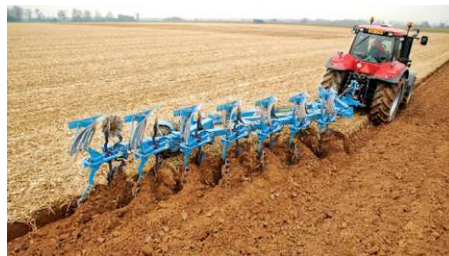
חריש בעבר ובימנו

את השיבולים אלמו באלומות בשדה והובילו אותן לגורן. בגורן דשו את השיבולים (הפרידו בן המוץ – הקליפה – לגרגירים) בחבטות במקלות או במורג הרתום לשור או לחמור המסתובב במעגל. אז היו זורים את המוץ ברוח, והגרגירים צנחו ארצה. בשלב מאוחר יותר טחנו אותם באבני רחיים או במכתש ועלי, ומהקמח אפו לחם. היום גם זאת עושה הקומביין: הוא משלב בתוכו את כל שלבי הפרדת הגרעין: חיתוך קני השיבולת בסכינים חדות והפרדת הגרגירים. ואת הגרגירים טוחנים לקמח במפעל.