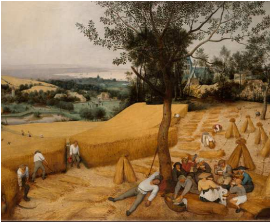
פיטר ברויגל האב | הקציר 1565