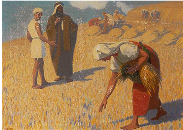
גבהרד פוגל | רות ובוועז בשדה 1920