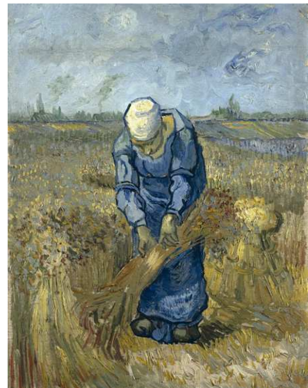
וינסנט ואן גוך | אישה מאגדת אלומות אחרי הקציר.