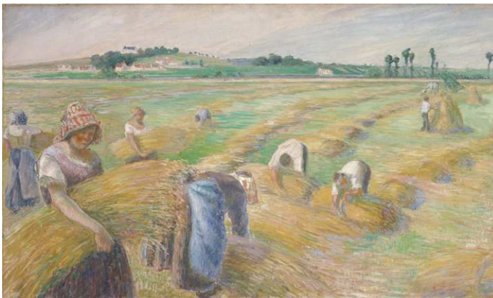
קמיל פיסרו | הקציר 1882