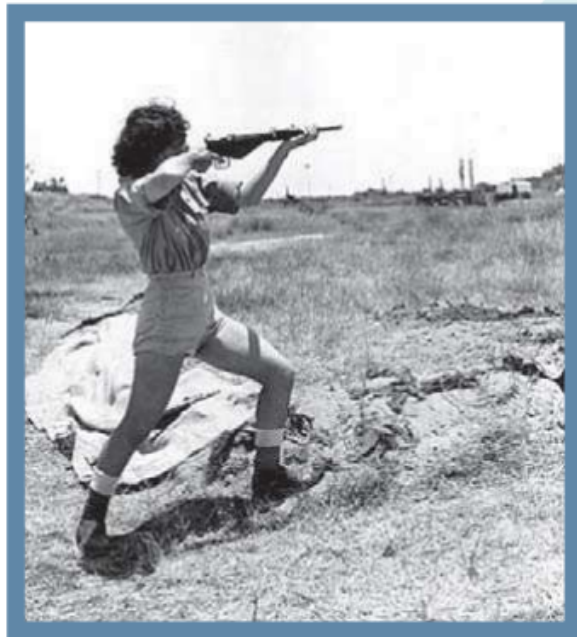
חברת ההגנה מתאמנת בנשק (1948).

היישוב היהודי בארץ ישראל של לפני כ-120 שנה מצא את עצמו לא פעם ולא פעמיים מול מתקפות; לעיתים היו אלו שודדים שפרצו אל היישובים החקלאיים ורצו לגנוב מחיות המשק או מהתבואה, ולעיתים היו אלו פורעים שרצו לפגוע ביהודים וביישובים היהודים עצמם על רקע לאומי או דתי. לשם כך שכרו תושבי המושבות היהודיות את שירותיהם של ערבים וצ'רקסים בני הארץ, כדי שישמרו על השדות ועל המשקים.