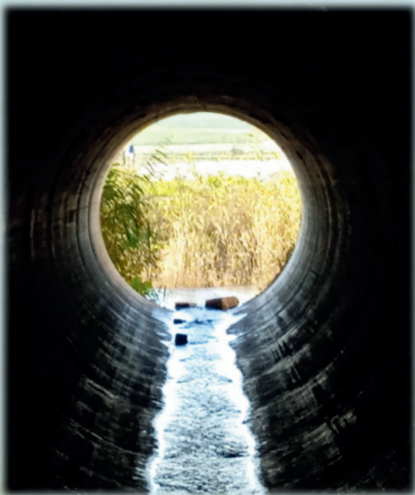
שתיים כוס רציפות - רוזה אבוס חיצונית אלן

כוס ברכה נשא לנו, לבנותינו ולבנינו ולכל מעשה ידינו לפרי האדמה ולתנובת האדם לחיים ולברכה. ויהודה לעולם תשב וירושלים לדור ודור. וגר זאב עם כבש ונמר עם גדי ירבץ יהי שלום בחילינו