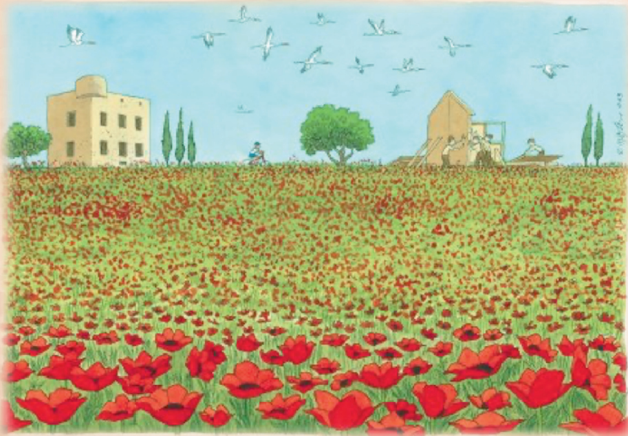
איור מאת מישל קיסקה, כחלק מפרוייקט "זיכרון צולט":

"הכלנית היא כידוע פרח מוגן ובשבת השחורה של ה-7 אוקטובר הגנה ראויה הייתה כה חסרה חוץ מכיתות הכוננות הנפלאות. אני יודע שהצבע האדום מתכתב עם צבע הדם שנשפך אך אני מקווה שבכל זאת תראו באיור מסר אופטימי, מסר של הזדהות, אהבה ותקווה." (מישל קיסקה)