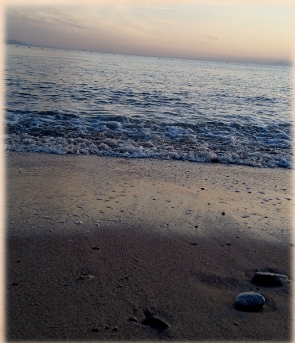
שוחים כוס שלישית - כולה ארום

כוס שלישית נשא בדמע ותהא לאות ולזיכרון לכל אלו שהארץ לא האירה להם פניה. עין במר בוכה על רבבות ואלפים ששלמו ביקר שבדמים. נשא תפילה למען אלו יושבי חושך וצלמוות אור גדול יזרח מאופל וישובו מהרה לביתם.