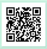
שַׁבַּת בְּבוֹקֵר אֲרִיק אֵינְשֵׁטִין

בַּפְּרָשָׁה מְזַכְּרִים אַרְבַּעַת הַמִּינִים "וּלְקַחְתֶּם לָכֶם בְּיוֹם הָרֵאשׁוֹן פְּרִי עֵץ הָדָר כִּפַּת תְּמָרִים וְעֵנָף עֵץ-עֵבֶת וְעֵרְבֵי-נָחַל.." (כ"ג מ') מָהֶם אַרְבַּעַת הַמִּינִים וּבְאִיזָה חֹג מְשִׁתְּמָשִׁים בָּהֶם?