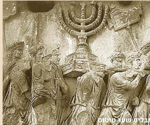
תבליט שער טיטוס

שער טיטוס הוקם בשנת 82 לספירה ברומא ועומד שם עד היום. בשער תבליט מפורסם של דמויות הנושאות את הביזה מבית המקדש לרומא. בביזה נמצאת גם המנורה. בשנת 70 לספירה, החריבו הרומאים את ירושלים ואת בית המקדש השני. טיטוס, מפקד הצבא הרומי, לקח את המנורה ואת שאר כלי המקדש לרומא, והציג אותם בתהלוכת ניצחון בחוצות העיר. התהלוכה, שבה שבויים יהודים נושאים את המנורה, הונצחה בתבליט על שער טיטוס. מנורה זו, כמו מנורת המקדש, היא בעלת שבעה קנים, אך לה רגל שונה מהמתואר בפסיפסים ובתלמוד.