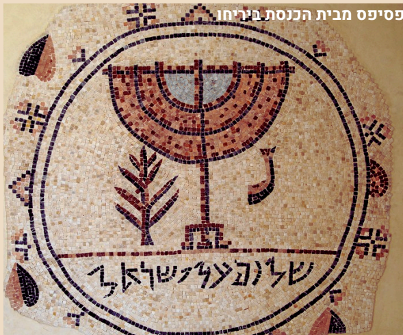
פסיפס מבית הכנסת ביריחו

שלום על ישראל הוא בית הכנסת העתיק של יריחו. בית הכנסת הוקם במאה השביעית לספירה והוא פונה מערבה לכיוון ירושלים. בבית הכנסת פסיפס ובו מנורה והכיתוב "שלום על ישראל" הפסיפס מתוארך למאה השלישית לספירה. בחפירות ארכיאולוגיות ברחבי ארץ ישראל התגלו פסיפסים רבים מתקופת המשנה והתלמוד ובהם מנורה. בבית אלפא התגלה בית כנסת שכל רצפתו עשויה פסיפס ובו כל כלי המקדש ובהם גם המנורה.